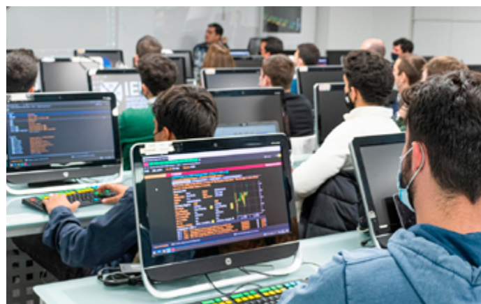
Alumnos de IEB especializándose en la Sala Bloomberg

En IEB, a través del Departamento de Orientación profesional se trabaja para que las prácticas profesionales sean la entrada de todos sus alumnos a su futuro profesional.