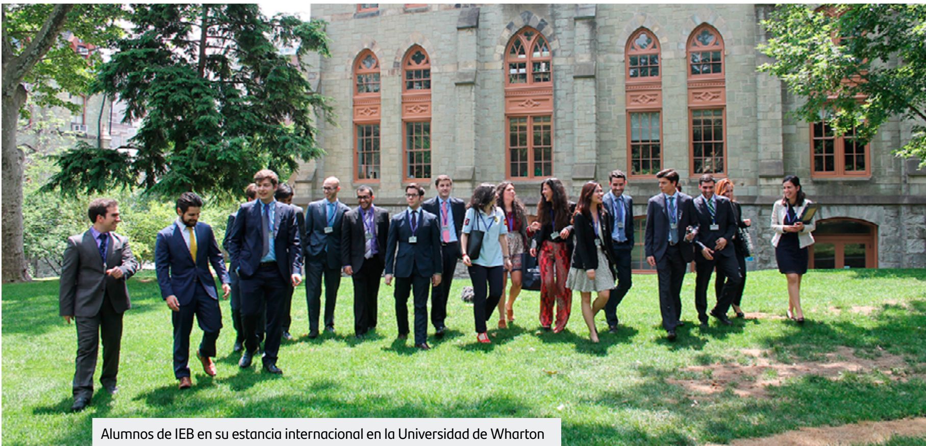
Alumnos de IEB en su estancia internacional en la Universidad de Wharton

El IEB, gracias a su claustro de profesionales de prestigio y su orientación práctica, vuelve a liderar los ranking especializados .